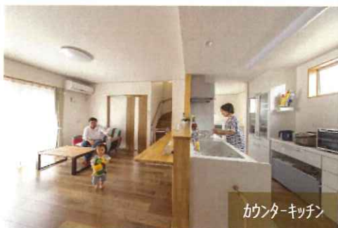
カウンターキッチン